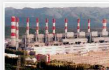
Pembangkit Listrik Maenoh