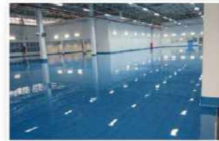
Perusahaan Air Minum Siam