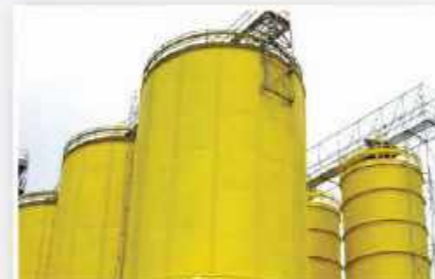
Pabrik Charoen Pokphan