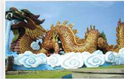
Museum Dragon Descendants