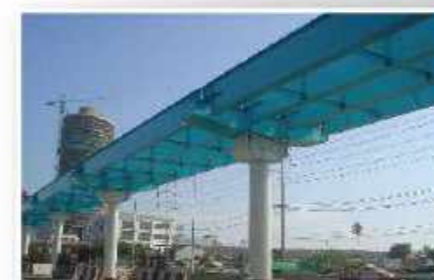
Jembatan Rama 3